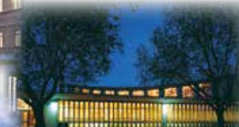
KARLSRUHE - Schwarzwaldhalle