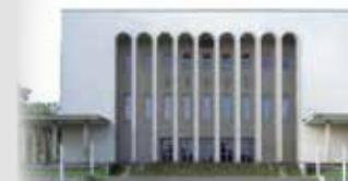
BIELEFELD - Rudolf-Oetker-Halle