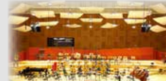
HANNOVER - Landesfunkhaus