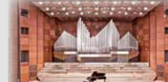
NÜRNBERG - Meistersingerhalle