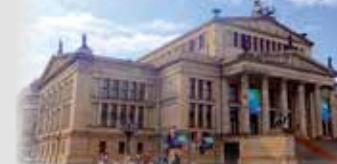
BERLIN - Konzerthaus