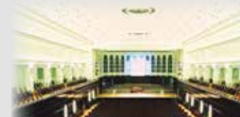
BREMEN - Die Glocke